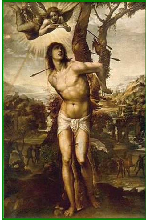
S. Sebastiano Martire