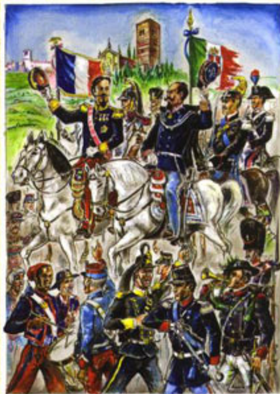
L'incontro fra re Vittorio Emanuele II e l'imperatore Napoleone III

150° Anniversario 2 a Guerra per l'Indipendenza d'Italia 1859 - 2009